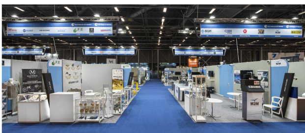
Photo 2019 – Pavillon avant ouverture au public

Lien vidéo Milipol Paris 2019 sur youtube :